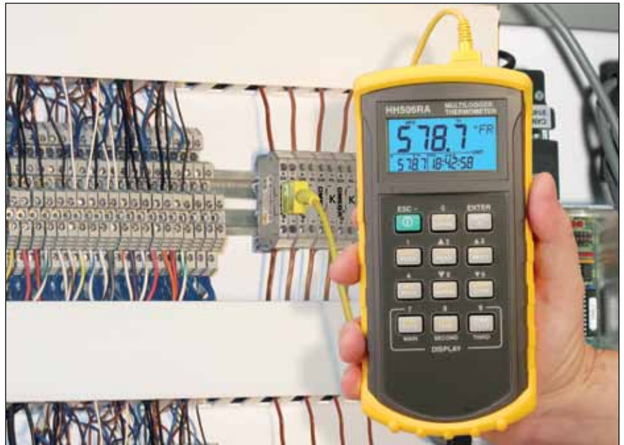
Se muestra con cable RECK1-10 y con el registrador de datos/termómetro HH506RA, con interfaz RS232C.

La nueva serie DRTB de bloques de terminales de termopar está fabricada con aleación de termopar de calidad para garantizar lecturas precisas. El receptáculo hembra compatible con SMP incorporado acepta un conector miniatura para termopar. El conector hembra permite al usuario conectarlo a un medidor portátil para aplicaciones como la recolección de datos, para la conformidad con el control de calidad, estudios de capacidad y reparación o resolución de problemas de instalación. La cubierta de plástico está fabricada con resina termoplástica con poliamida gris 6,6 con una clasificación UL 94 V0 para