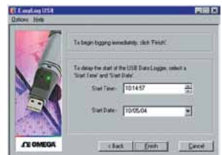
Software para Windows: ventana de inicio del registrador