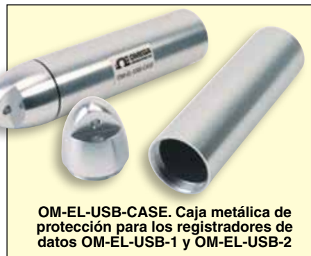
OM-EL-USB-CASE. Caja metálica de protección para los registradores de datos OM-EL-USB-1 y OM-EL-USB-2