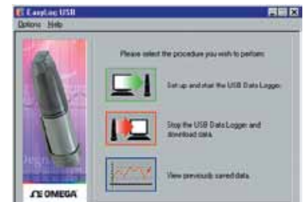
Software para Windows: ventana de configuración inicial

Dimensiones: Vea la ilustración dimensional