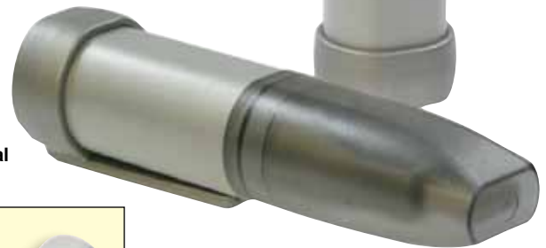
OM-EL-USB-1, se muestra en un tamaño inferior al real