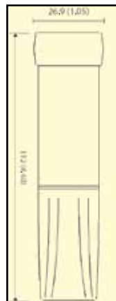
OM-EL-USB-3, -4 Dimensiones: mm (pulg.)