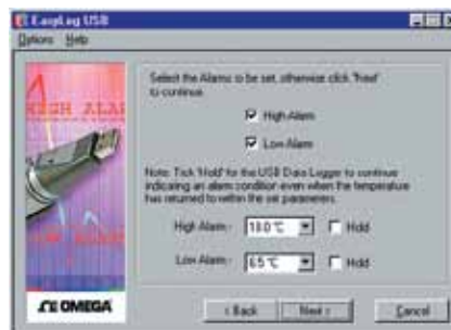
Software para Windows: ventana de configuración de alarma